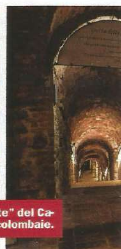
Altri dettagli delle sale dell'osteria con al centro la "Maddalena penitente" del Cagnacci. A ds., la discesa nelle grotte dove è conservata una collezione di colombeaie.